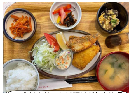
旬の食材を使った料理はどれも絶品！

うんめえもん市で手に入れた矢祭米は、粒がしっかりしていて、もちもち。とても美味しくて、このお米を自分のお店で出したいと思いました。