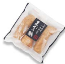
油麩 (3 本入り) 280 円

佐藤さん) 油麩 です。常備しておくとお利便な優れものですね。お味噌汁に入れるとコクが出て美味しいですし、油麩丼も簡単にできると地元の友人たちには評判がいいですよ。