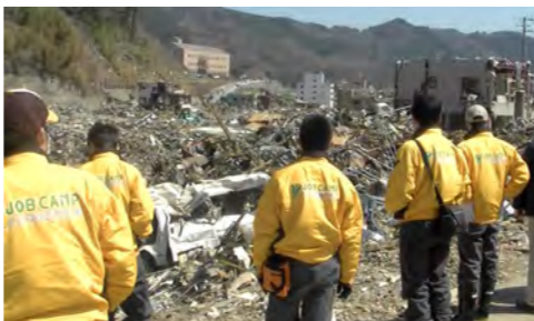
4月11日先発メンバーで初めて石巻入り

よこはま型若者自立塾 JobCamp の活動として震災発生1ヶ月後から現地入りし、これまで計約500名の若者が石巻で活動してきました。石巻からの物産を販売する「うんめえもん市」の開催も3月29日の中区役所で563回を迎えました。3月は特別なイベントを加えて「うんめえもん市」を開催しました。