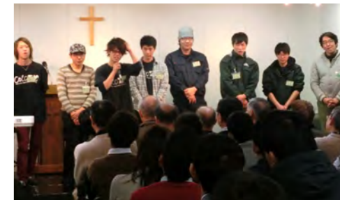
横浜から石巻へ移住して現地の水産加工会社などで働いている若者たち

14:00~、K2ビル4Fにて、石巻活動報告会を行い、石巻や横浜のメンバーやその親御さん、地域の方々など総勢100名の方が集まりました。特に今年は石巻の地元の方々やK2の若者による新しい地域活性の動きについて報告しました。K2の若者たちが地元で力になっていると感じています。