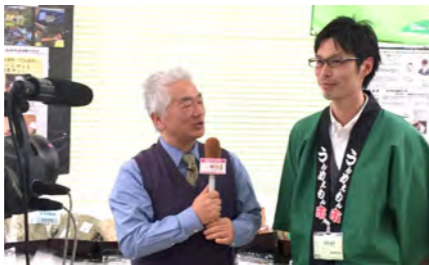
尾中区長と高岡君とのインタビュー風景