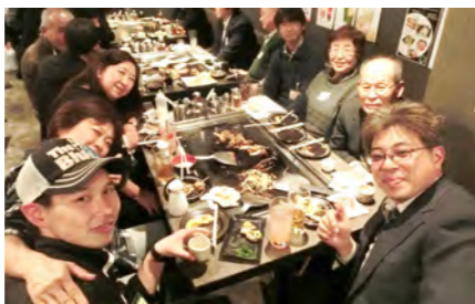
楽しいひと時でした!