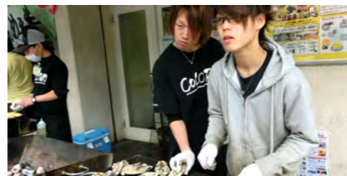
石巻で働く若者達も来場!