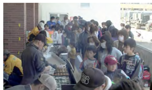
大街道小学校での炊き出しからスタートしました