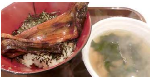
1日限定の石巻メニュー「穴子づくし定食」

2011年11月12日(土)にうんめえもん市は、ここK2ビルからスタートしました。牡蠣づくし、穴子づくし、穴子丼、焼き牡蠣、焼きホタテなど、石巻のメニューを提供しました。また、目玉商品として、石巻のたらこ、明太子、アルパジョンのアップルポテトパイやバームクーヘンなど、限定商品を販売しました。たくさんの地域の方がご来場されました。