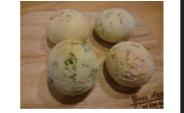
もちもち美味しそう!!