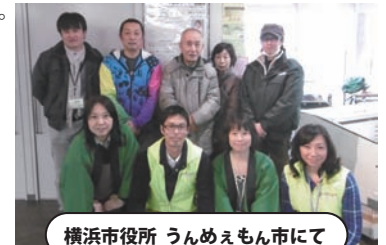
横浜市役所 うんめえもん市にて

『若者自立就労支援 × 石巻進化躍進応援』に微力ながらお役に立てればうれしい限りでございます。これまでの5年間、とにかく無我夢中で歩んでまいりました。今後も、食材王国みやぎの美味しい商品、健康に良い商品を都市部の皆様にご提案していきたいと思っております。簡単に食べられるものだけではなく、これからの時代の食育にも目を向け、ちょっとしたひと手間をかける素晴らしさをご提案もしながら、皆様のお役にたてれば幸いです。